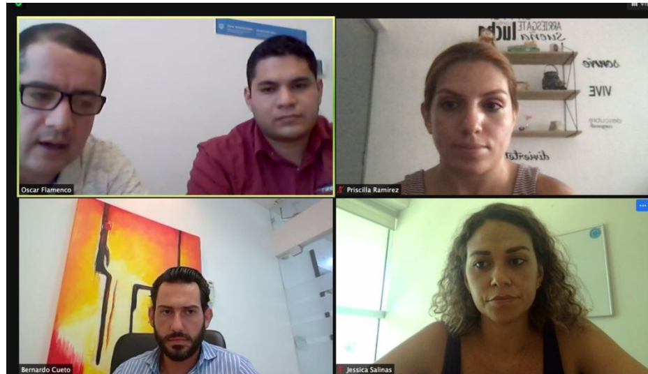
VR con Caribbean Tire para proyecto de ensambladora automotriz en Chetumal