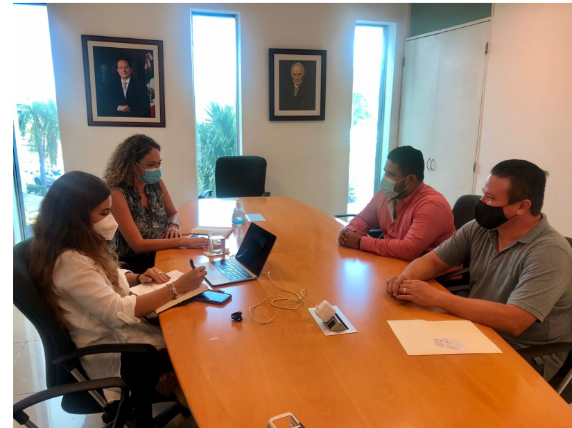
Reunión presencial con SEDETUR para colaboración en base de datos para proyectos en tema turístico